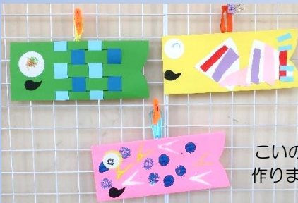
こいのぼりを 作りました